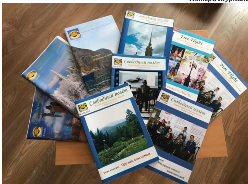
Фото: Е. Попенова