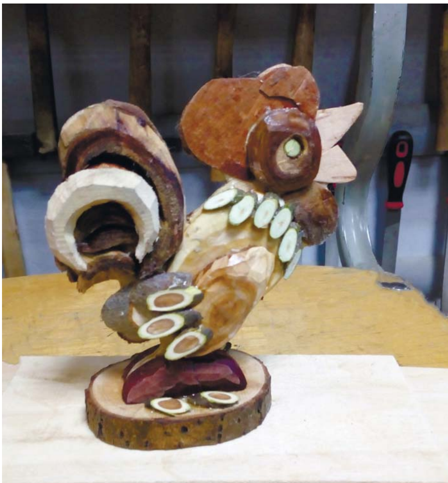
Сделал петушка — символ 2017 года