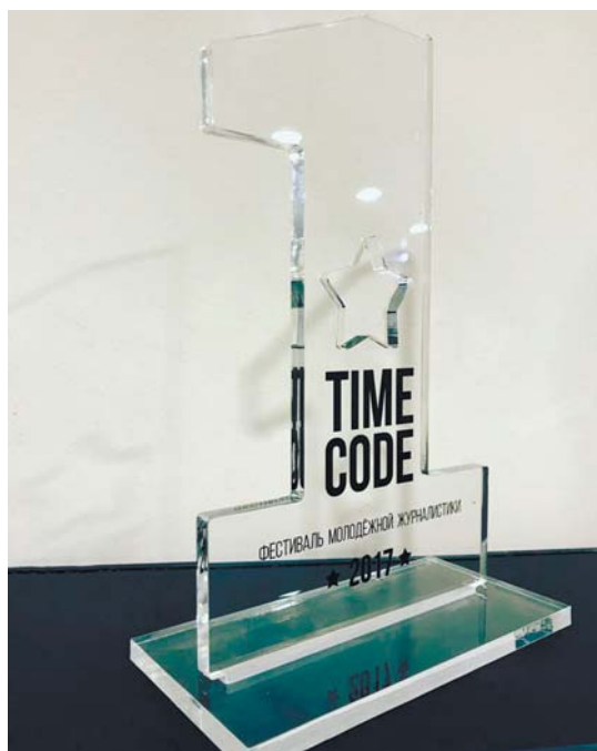
На обложке: Приз фестиваля «TIME CODE»